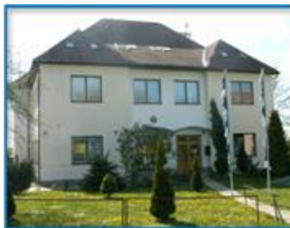
Obr.: Blok F

Pracoviště v Hodoníně se nachází na adrese: