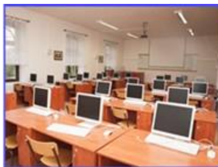
Obr.: Hodonín, blok K učebna K7