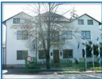
Obr.: Blok E - Rektorát